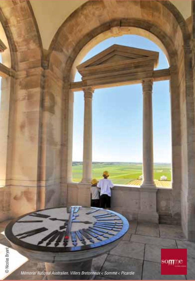
Conception graphique : www.grandnord.fr • 5734